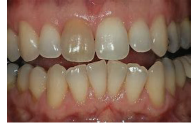
Kielezo cha 1: Jino lililozidiwa kuwa nyeusi

Tafadhali wasiliana na kliniki kwenye nambari ya simu hapo chini ikiwa unataka maelezo yoyote ziada.