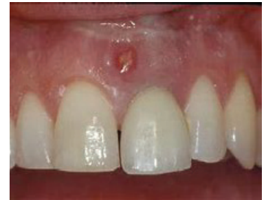
Kielezo cha 2: Uvimbe kati ya meno mawili ya mbele